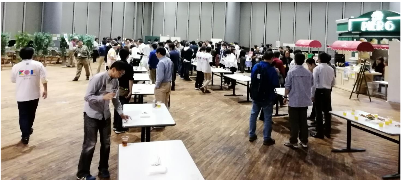
(ご参考) KOF2019 開催の様子