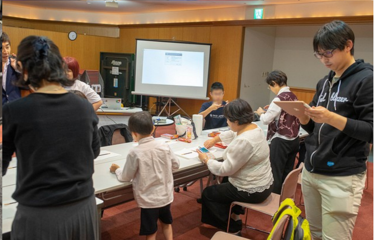
セミナー／ステージ企画の様相(KOF2018)